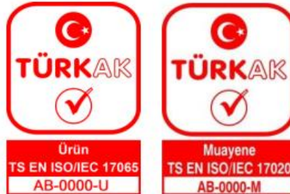
Şekil 2- Türkak Akreditasyon Markası

Akreditasyon sonrası yukarıda şekil 2'deki logoların en altında bulunan "0000" yerine Türkak tarafından EUTEST'e özel verilen numaralar eklenerek EUTEST akreditasyon markaları oluşturulacaktır.